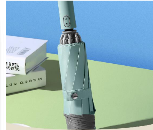
10K 3단 자동 거꾸로 우산