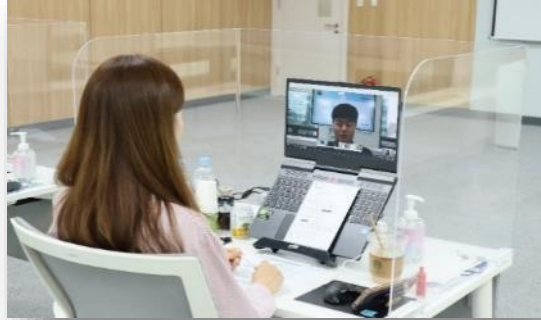
1차 Job Fair(1개월)