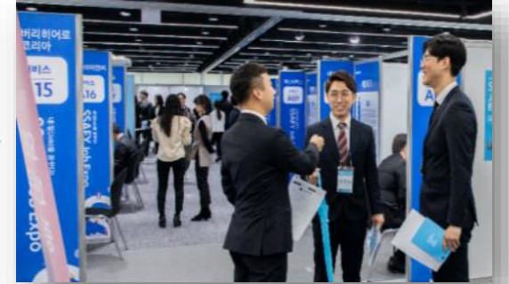
2차 Job Fair(1개월)